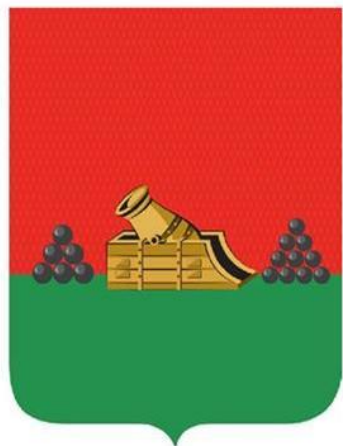
Многоцветный рисунок герба города Брянска

Герб города Брянска изображается в червленом (красном) поле, на зеленой земле золотая мортира, сопровождаемая по сторонам двумя пирамидами из черных ядер.