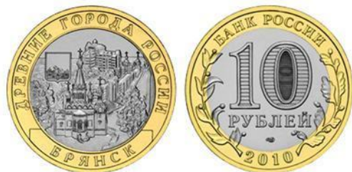
Памятная монета из серии «Древние города России»

1 марта 2010 года Банком России была выпущена монета номиналом 10 рублей, из серии «Древние города России», на реверсе которой изображён, герб Брянска.