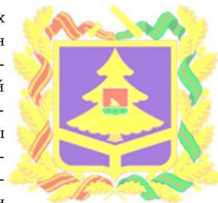
Герб Брянской области

20 ноября 1998 года Законом Брянской области «О символах Брянской области» был утвержден герб Брянской области в композиции которого на фоне центральной части был изображён исторический герб города Брянска. Авторы герба — бывший губернатор области Ю. Е. Лодкин и художник-дизайнер А. Зуенко. Герб области до настоящего времени, из-за многочисленных геральдических ошибок, в Государственный геральдический регистр Российской Федерации не внесён.