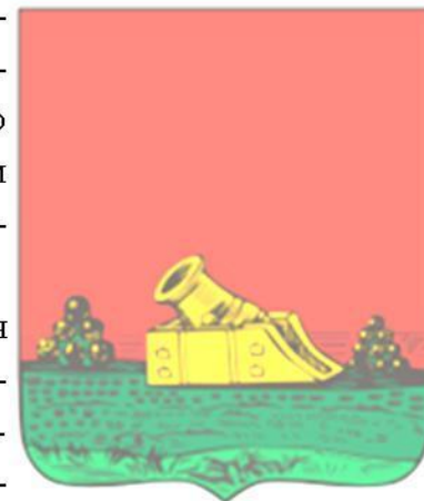
Герб Брянска (1781)

Верхнее поле щита является червленим (символ храбрости, мужество, неустрашимости) и графически изображается смесью кармина и розового лака строго чередующимися вертикальными линиями.