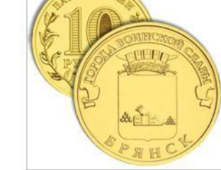
Памятная монета из серии «Города воинской славы»

25 марта 2010 года Указом Президента Российской Федерации Брянску присвоено почётное звание «Город воинской славы». Герб Брянска, выполненный из бронзы, размещён на стеле «Воинской славы», которую открыли 28 июня 2010 года.